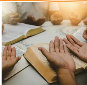
Table de la Parole de l'Avent au prieuré de Scry

Durant le temps de l'Avent, nous vous proposons quatre soirées de partage et de méditation de la Parole de Dieu.