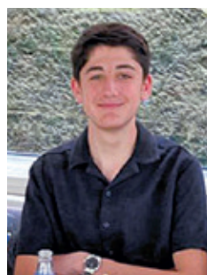
Bulletin communal d'Anthisnes

Cela, d'ailleurs, ne s'est pas limité à des travaux de nettoyage, d'entretien ou de jardinage, leur présence a aussi permis l'organisation d'une excursion à Dinant, occasion pour les uns et les autres de partager de chouettes moments. Un repas de fin de projet,