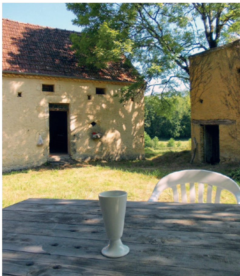
Maison de Miette et son mazagan.

« Lorsque j'arrive, seule, j'ai un petit moment de crainte à surmonter. Bien que j'adore cet endroit, il est tellement isolé que, tout d'un coup, un sentiment de solitude peut m'envahir. Alors, surtout, il ne faut pas s'asseoir, il faut se mettre de suite au boulot. Ne pas se laisser envahir par le découragement. L'important, c'est d'avoir de la rigueur. Je suis dans un endroit que je trouve magnifique, avec peu de confort, juste l'essentiel. Pour que